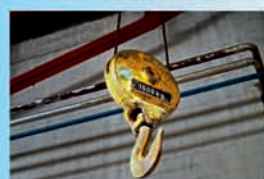
VTZ - ZDVIHACÍ ZAŘÍZENÍ