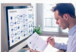
PROJEKTOVÉ ŘÍZENÍ A PROCESY