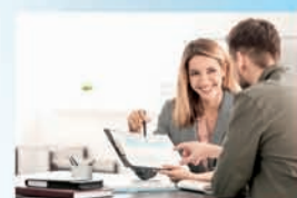
ÚČETNICTVÍ, DANĚ, MZDY