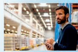
SKLADOVÁNÍ A LOGISTIKA