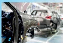
KVALITA A AUTOMOTIVE