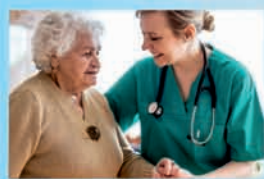
SOCIÁLNÍ SLUŽBY A ZDRAVOTNICTVÍ