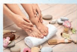
MANIKÉRKA A PEDIKÉRKA