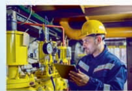
VTZ - PLYN A TLAK