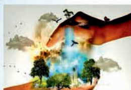
EKOLOGIE A EMS