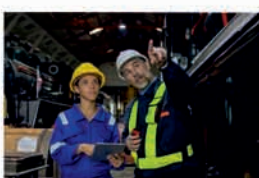
SM BOZP A PO