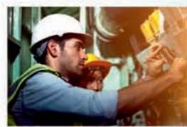
ÚDRŽBA, HYDRAULIKA, PNEUMATIKA