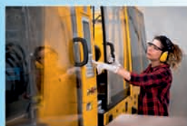
PLASTY, VÝROBA A ZPRACOVÁNÍ