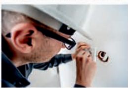
ELEKTRO A NV 194 2022 Sb.